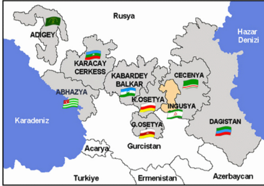
Şekil 1. Kuzey Kafkasyanın Siyasi Haritası